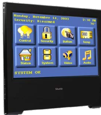
Steuerung Überwachung, Heimautomatisierung, Steuergerät