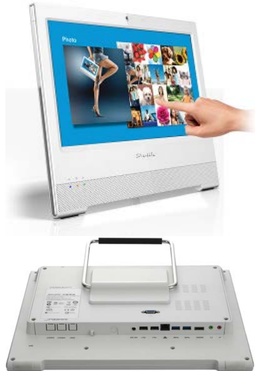
Die Bilder dienen nur zur Illustration.