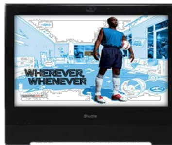
Präsentationen Visuelle Werbepattform am POS, Unterhaltung, Anzeige von Informationen im öffentlichen Bereichen

© 2015 Shuttle Computer Handels GmbH (Germany). Änderungen ohne Ankündigung vorbehalten. Abbildungen dienen nur zur Illustration.