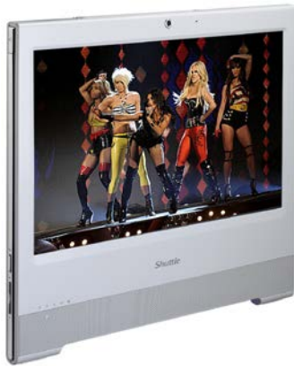
Unterhaltung Musik, Video, Foto-Galerie, TV* *) TV Tuner USB Stick erforderlich