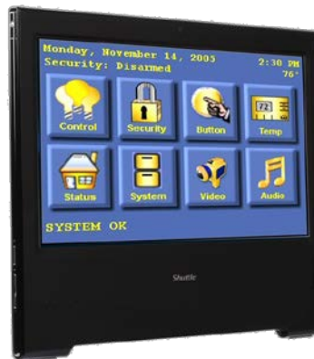
Steuerung Überwachung, Heimautomatisierung, Steuergerät