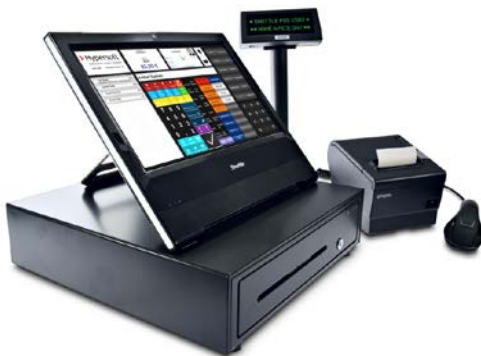
Kassensystem Produktauswahl, Kalkulation