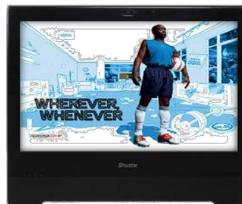
Präsentationen Visuelle Werbepattform am POS, Unterhaltung, Anzeige von Informationen im öffentlichen Bereichen

© 2015 Shuttle Computer Handels GmbH (Germany). Änderungen ohne Ankündigung vorbehalten. Abbildungen dienen nur zur Illustration.