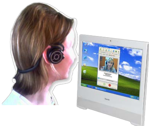
Kommunikation E-Mail, VoIP, Messenger, Blog, Videokonferenz