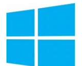
Windows 10 64-Bit