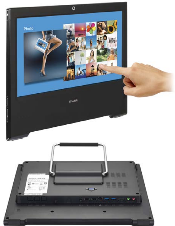
Die Bilder dienen nur zur Illustration.