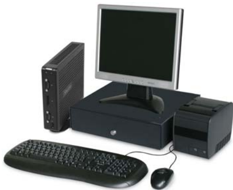
Kassensystem mit Shuttle XS36V-703