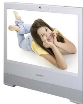
Weiterbildung In der Schule, zu Hause, für Kinder und Erwachsene