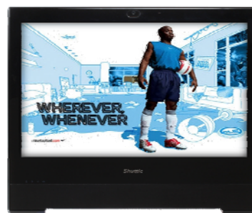
Präsentationen Visuelle Werbepattform am POS, Unterhaltung, Anzeige von Informationen im öffentlichen Bereichen