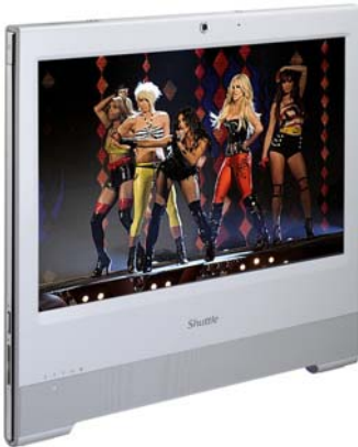
Unterhaltung Musik, Video, Foto-Galerie, TV* *) TV Tuner USB Stick erforderlich