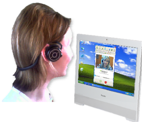
Kommunikation Email, VoIP, Messenger, Blog, Videokonferenz