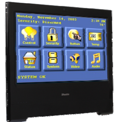
Steuerung Überwachung, Heimautomatisierung, Steuergerät