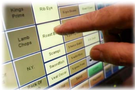
Kassensystem Produktauswahl, Kalkulation