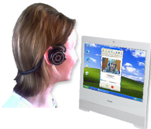
Kommunikation Email, VoIP, Messenger, Blog, Videokonferenz