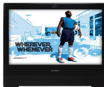
Präsentationen Visuelle Werbepattform am POS, Unterhaltung, Anzeige von Informationen im öffentlichen Bereichen