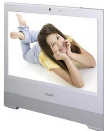
Weiterbildung In der Schule, zu Hause, für Kinder und Erwachsene