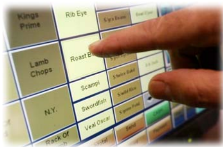
Kassensystem Produktauswahl, Kalkulation