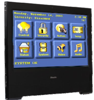
Steuerung Überwachung, Heimautomatisierung, Steuergerät