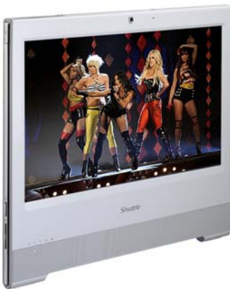
Unterhaltung Musik, Video, Foto-Galerie, TV* *) TV Tuner USB Stick erforderlich