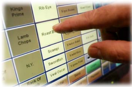
Kassensystem Produktauswahl, Kalkulation