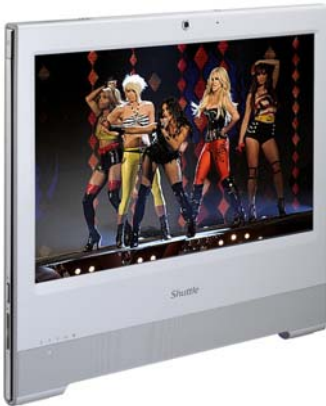
Unterhaltung Musik, Video, Foto-Galerie, TV* *) TV Tuner USB Stick erforderlich