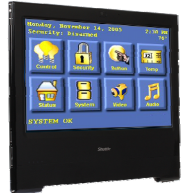
Steuerung Überwachung, Heimautomatisierung, Steuergerät