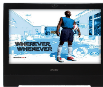
Präsentationen Visuelle Werbepattform am POS, Unterhaltung, Anzeige von Informationen im öffentlichen Bereichen