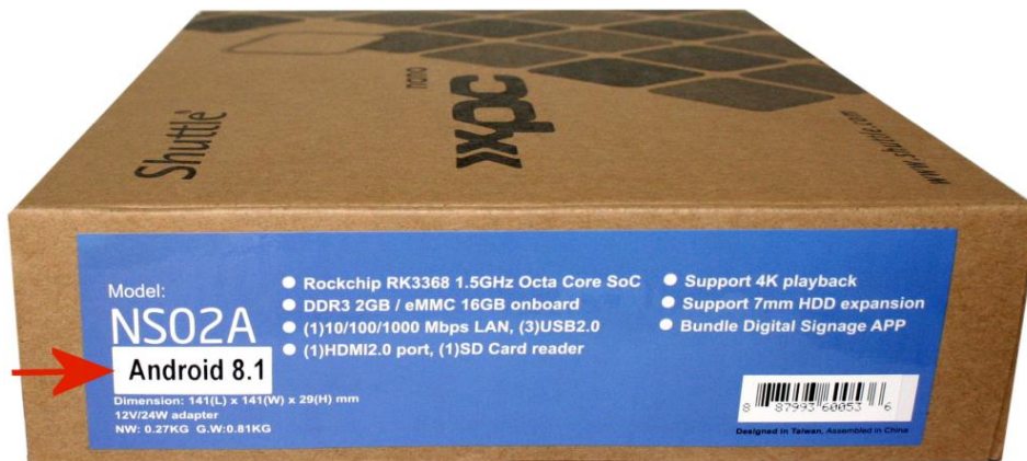
Neue Android-Version wird auf der Verpackung angezeigt.

Das NS02A/E Android 5.1 kann nicht durch den Endkunden auf Android 8.1 upgedated werden. Dies ist ein kostenpflichtiger Service von Shuttle ( support@shuttle.eu ).