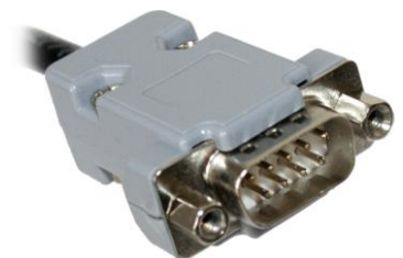
9 Pin D-Sub Anschluss